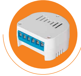
القابس الذكي بمدخلين