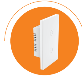
مفاتيح الإنارة الذكية