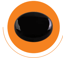
Smart IR remote control