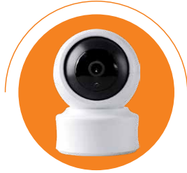
كاميرا المراقبة الذكية